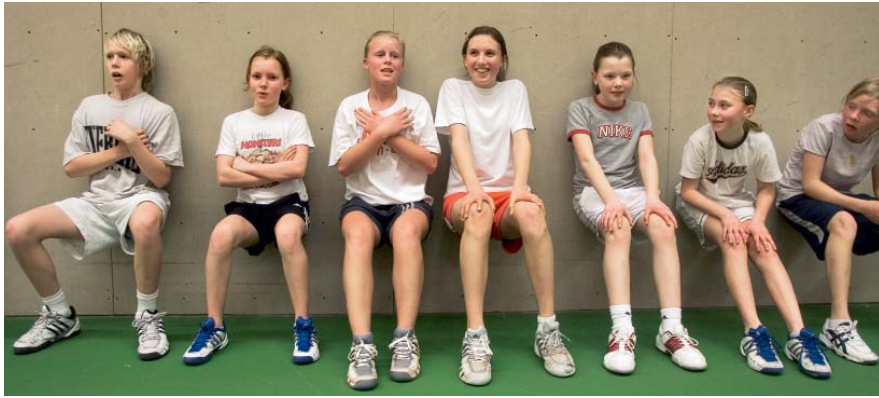
Fartfyllda benvingar får snabbt upp pulsen.